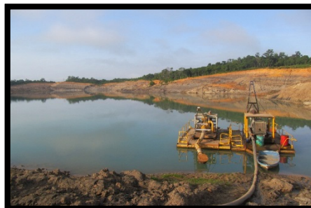
Gambar 2.1. Sump

Berdasarkan tata letak kolam penampung ( sump ), sistem penirisan tambang dapat dibedakan menjadi :