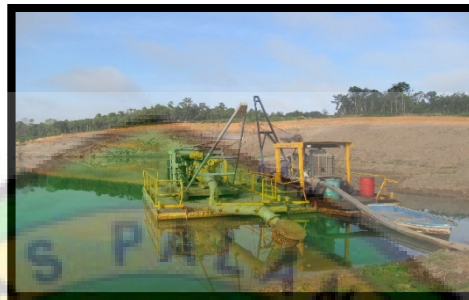
Gambar 2.2 Pompa pada sump

terpasang terpisah untuk memompa air bersih (tidak berlumpur), dimana air tambang yang terkumpul diendapkan terlebih dahulu untuk memisahkan air jernih dengan endapan lumpur pada suatu sumur pengendap.